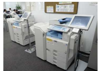
実際のザ関所設置後の複合機 空いている複合機を積極的に活用できる