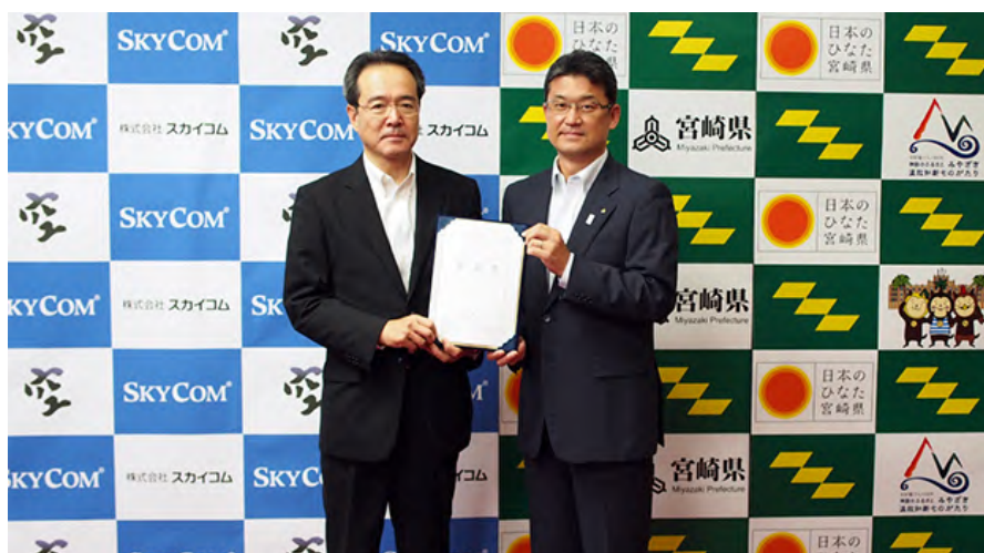
【調印式の様子】 宮崎県知事 河野 俊嗣（右）、株式会社スカイコム 代表取締役社長 川橋 郁夫（左）