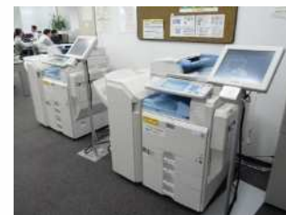
実際のザ関所設置後の複合機 空いている複合機を積極的に活用できる